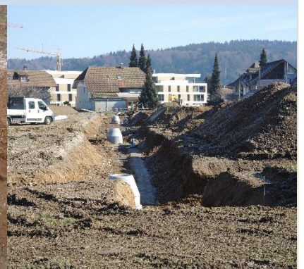
Aushub Ver- und Entsorgungsleitungen