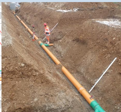
Bau der Schmutzwasserleitung